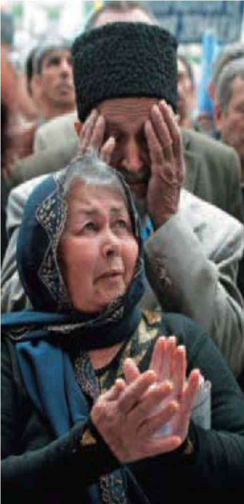
Tártaros de Crimea en Simferópol, Ucrania, durante la conmemoración del sexagésimo aniversario de su deportación masiva a Asia Central durante la Segunda Guerra Mundial.