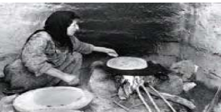
Muchos kurdos se convirtieron en apátridas como resultado de la guerra entre Irán e Iraq.

Un apátrida es alguien que, en virtud de la legislación nacional, no goza de la ciudadanía de ningún país, es decir, del vínculo jurídico que existe entre el Estado y el individuo. El artículo 1 de la Convención sobre el Estatuto de los Apátridas de 1954 establece la definición legal del apátrida señalando que se trata de toda persona que no sea considerada como nacional suyo por ningún Estado conforme a su legislación.