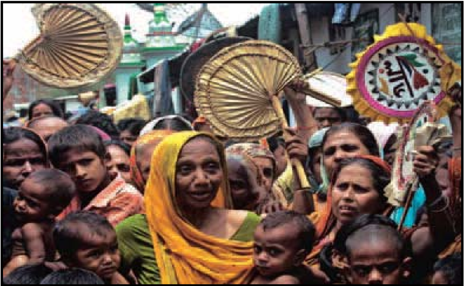
Apátridas biharis protestan en las calles de Dhaka, ciudad donde no se les ha concedido su ciudadanía desde la independencia de Bangladesh en 1971.