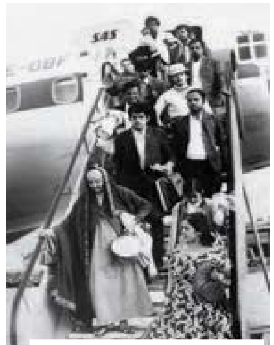
Cientos de miles de asiáticos fueron expulsados de Uganda de manera arbitraria en la década de 1970 y se convirtieron en verdaderos apátridas.

A los Estados se les está exhortando para que se adhieran a las dos Convenciones sobre apatridia. Un logro particular fue el estudio que realizó el ACNUR en 191 países en el año 2003. Los resultados de este estudio han contribuido a crear por primera vez un escenario mundial que ayudará al ACNUR y a los gobiernos a ampliar o introducir nuevas leyes y proyectos para abordar el problema.